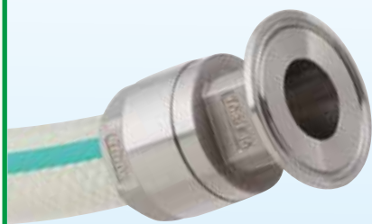
TOYOCONNECTOR TC3-F (无树脂圈型)