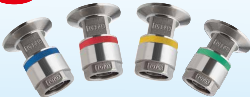
树脂圈有蓝色、红色、黄色、绿色等4种颜色